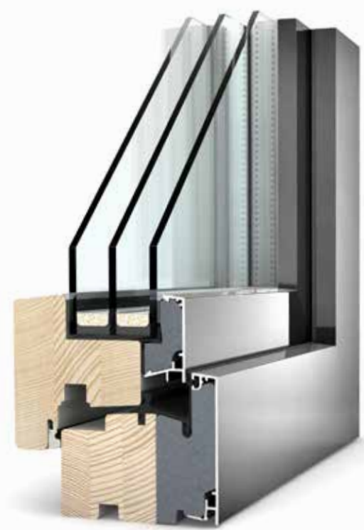
Illusztráció: HF 200 ablakrendszer

IRÁNYMUTATÓ MEGOLDÁSOK A JOBB ENERGHATÉKONYSÁGÉRT, TARTÓSSÁGÉRT ÉS DESIGNÉRT