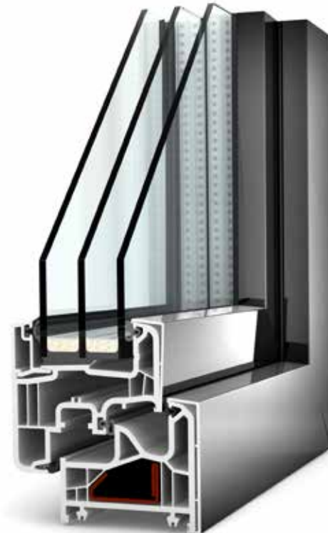
Illusztráció: KF 200 ablakrendszer

INTERNORM MŰANYAG ÉS MŰANYAG/ALU ABLAK Mekülönböztető jellemzői: